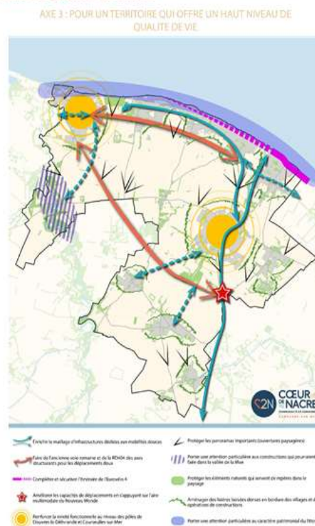
Carte de synthèse de l'Axe 3

Cet axe se concentre sur les équipements, les services, les mobilités et la protection du cadre de vie.