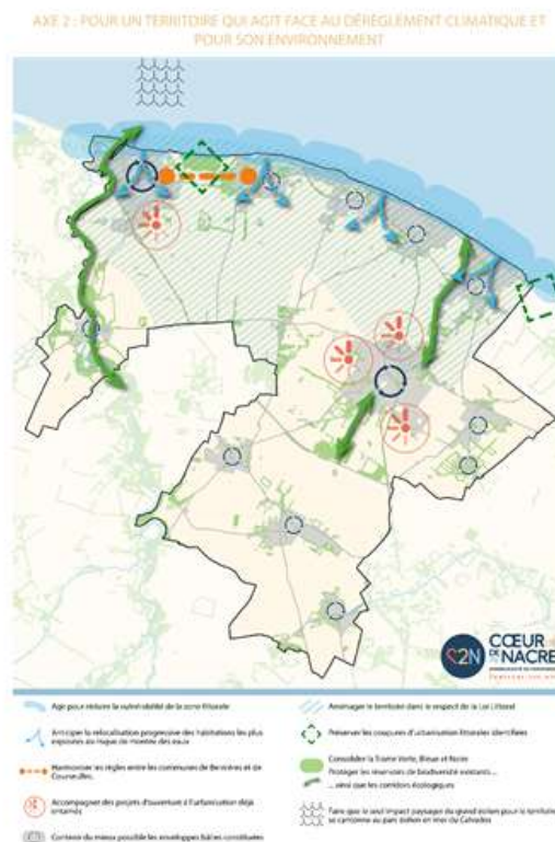
Carte de synthèse de l'Axe 2

Cet axe porte sur les réponses aux enjeux climatiques, la protection de l'environnement et la transition énergétique.