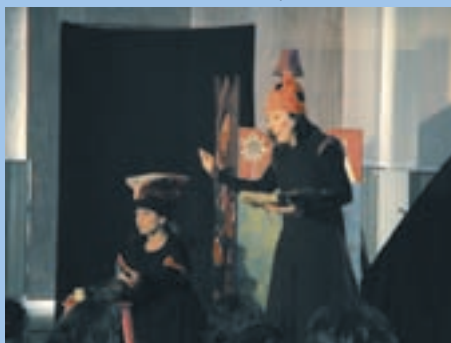
Spectacle de Noël du RAM

-Un vendredi sur deux, à Anguerny, salle de la mairie de 9h30 à 11h30, et à Saint Aubin,