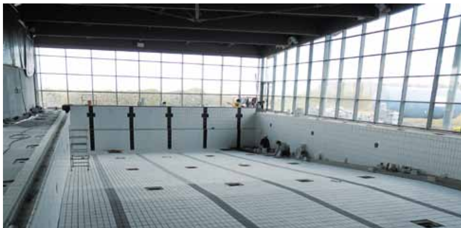
→ Le carrelage a été posé