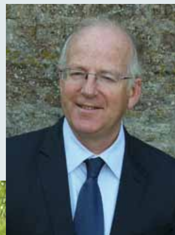
Alain Yaouanc Président de la Communauté de communes