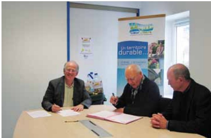
→ Signature de la convention

L'association des Bouchons du Cœur de Normandie a été créée en 2009. Inquiets du devenir de leurs enfants déficients vieillissant, des parents, amis et bénévoles ont souhaité constituer un réseau d'entraide.