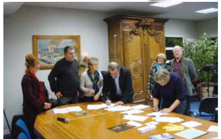
→ Signature de la charte