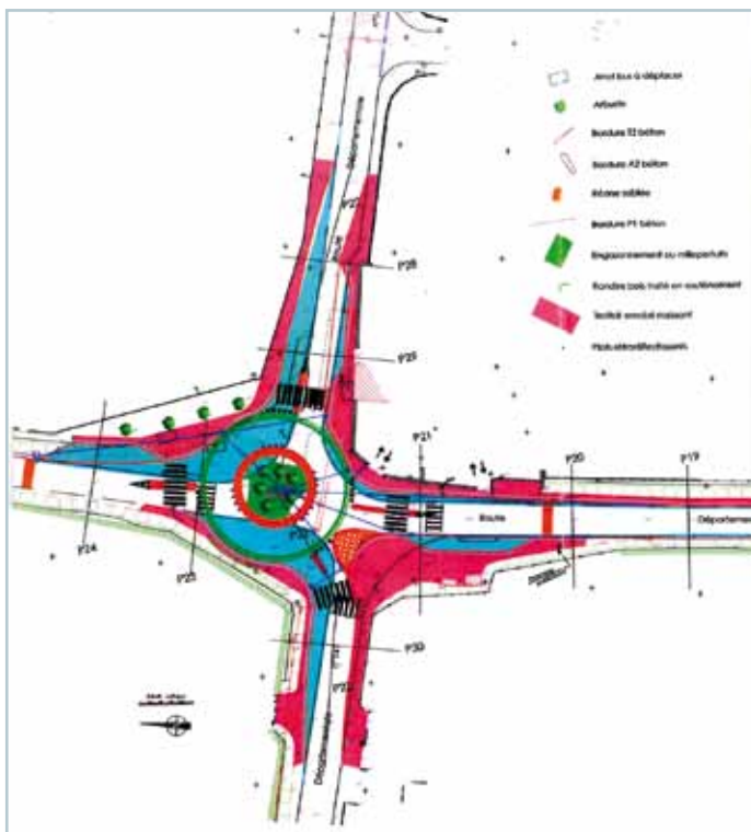
→ Projet final

Pour la phase terminale du chantier, courant janvier, une circulation par alternat est envisagée pour faciliter la circulation des usagers.