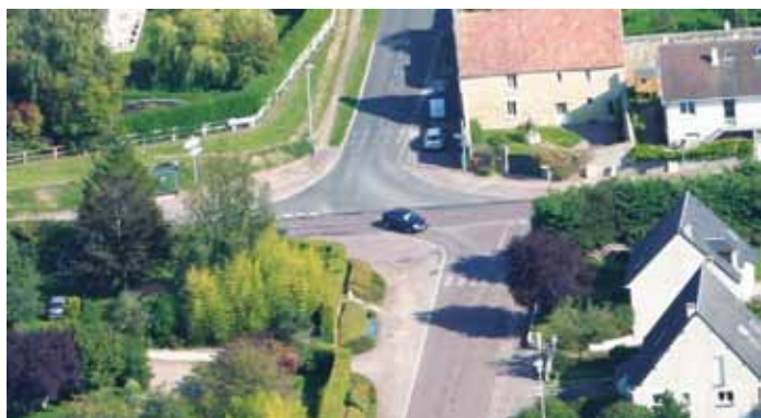
→ Avant les travaux

L'aménagement de la traverse de Colomby-sur-Thaon sur RD79 et RD141, travaux sous maîtrise d'ouvrage du Conseil Général du Calvados et de la commune, va prochainement arriver aux deux tiers de sa réalisation.