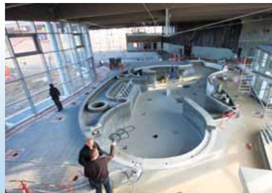
→ Bassin ludique