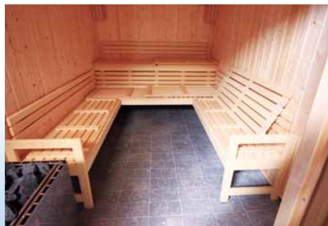
→ Le sauna

Bien entendu, une place de choix sera réservée à l'apprentissage de la natation par les scolaires.