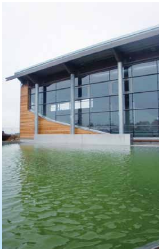
→ Bassin extérieur