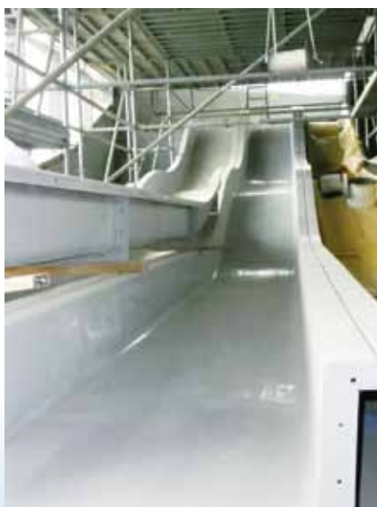
→ Mise en place du pentaglis