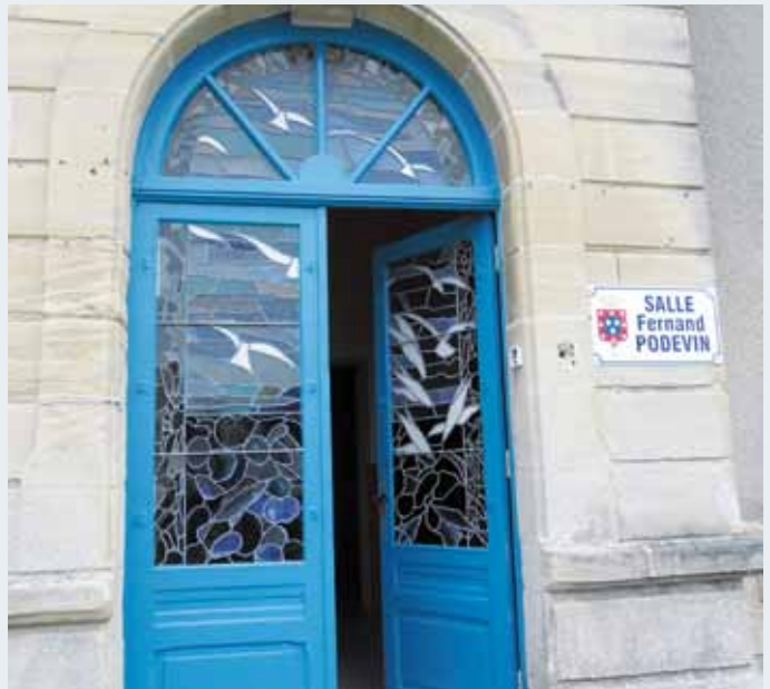
→ Porte de l'ancienne mairie.....