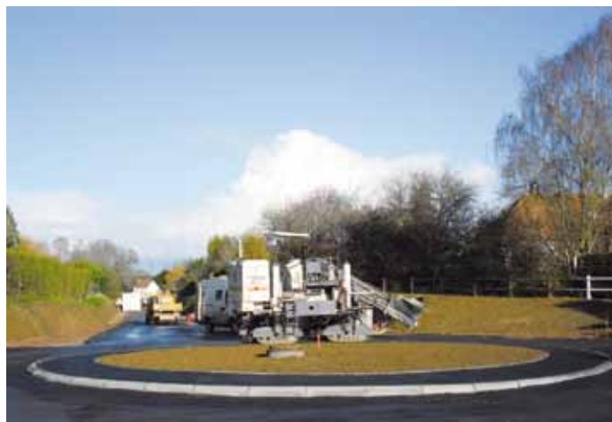
→ Aménagement du giratoire